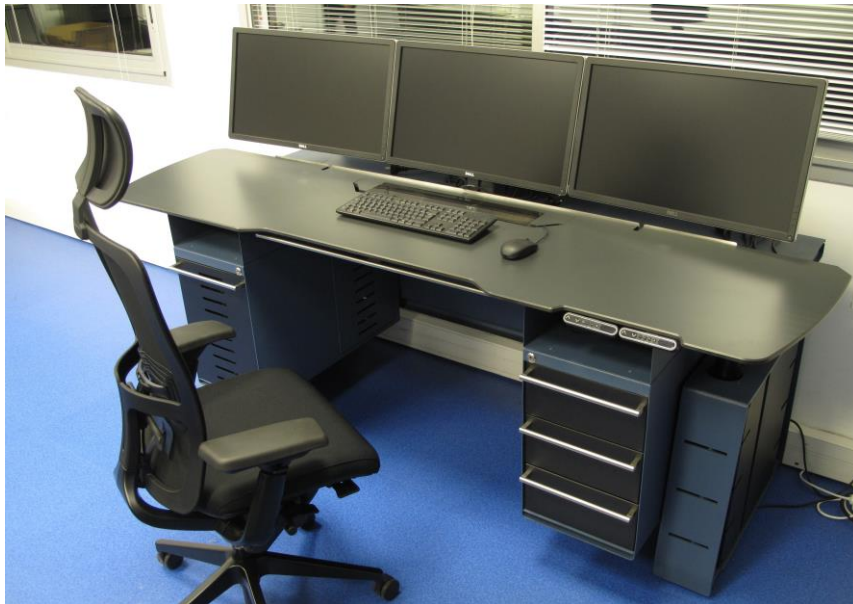
Console AX avec plan de travail monte et baisse électrique