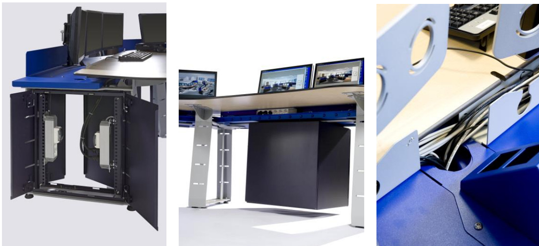
Console AX. Principe accès câblage

Pour les couleurs et finitions, voir www.polyrey.com , choisir dans Papago pour les unis et Origine pour les tons bois