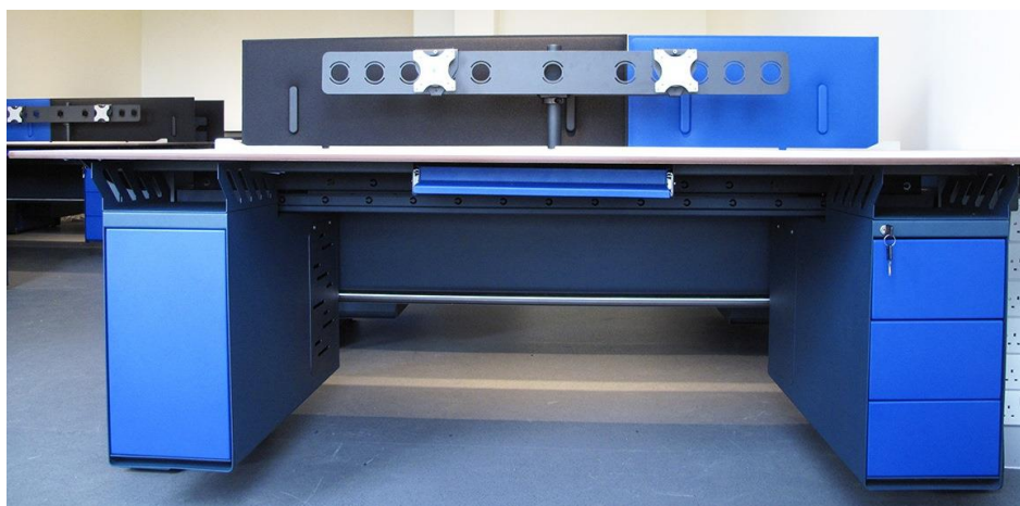
Console AX largeur 2 000mm équipée d'un caisson UC, un caisson bloc tiroirs, un tiroir et d'un support d'écrans.