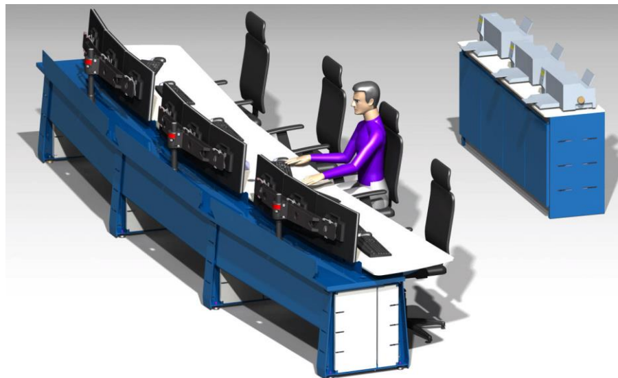
Console AX perspective vue arrière